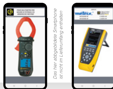
C.A. 529x "ASYCIV"

Das hier abgebildete Smartphone ist nicht im Lieferumfang enthalten